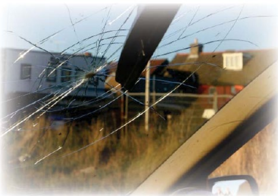
(VIN) ไว้บนหน้าต่างของรถ จะทำให้ขโมยไม่สามารถนำรถหรือชิ้นส่วนของรถไปขายต่อได้โดยง่าย