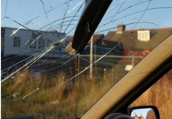
በመኪናው መስኮት ላይ ተቀርጾ ከሆነ፣ ሌሎቹ መኪናውን ወይም የመኪናውን አካሎች ለመሸጥ ያስቸግራቸዋል።